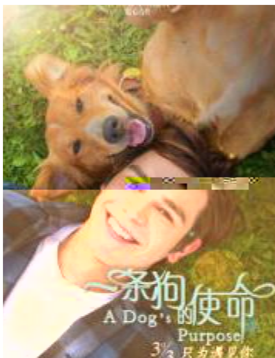
W 荣道 O 狗 K 自 t 多? o 生 在 ?? 生K ] + 狗 同

K Oc ^ + O 人身 故事 真实地: K + 狗 u 8 人 w 所 = 在 义 LK 里 狗狗分 , 人 间 + 人和宠 间 情感, MN 真 情 + u 生 K i 考, 人 外 h 容 片 身 狗狗 " t + 且 而 WX 成 + Y 此 生 K 分 Z 分 _ 种 同 它 ST 人 s 成 身 [ \ ] ^ _ 和 ` a + 场、 地 g 外! 生 时 还 h i j _ 天 它 3 + 狗 R 悲 外 R k Q J 人 B 生 l 、 1 安 x m 上 它 % n 在 然 狗 狗 h 片 成 孤 T ; < 人 身 边 RT 而 o p 行 q r s t 时 “狗” 而 o 3 人 狗 间 h、 它 j 人 \ u v 身 wx , y z { | , 同时 还 狗 狗 安 + ( 多 内 心 独 人 ^ Oc } $$$ 事 实 上 u ~ . , 能 地 + : ^ 狗 狗 心 V h 变 化 人 Oc 情 感 h 戳 人 心 6 7 G _ 故 事 “ ” o 生 t 所 s 它 , M 人 闺 x T 同时 还 巧 牵 红 线 来 狗 t + 生 V t 8 宠 红 娘 M 人 从 T 身 ^ 人 妻、 人 母 全 _ g 生 狗 苦 宠 狗 安 过 程 O o 要 c d 者 义 P 凡 _ 好 变 畏 者 狗 ? 它 t 千 辛 万 苦 ^ O 人 身 边 仅 再 H 帮 身 变 容 易 观 所 而 这 g 情 感 ! 人 再 3 6 时 期 ^ 神 技 , 人 7 c " 复 杂 人 # 个 体 $$$ 这 狗 个 R 认 成 功 成 就 + 全 片 O E 情 漫、 感 人 肺 腑 人 身 上 % , 行 生 V , 情 感 3 & $$$ * 伤 潮 6 , h' ( ` 人 ) h 行 独 居 J , 人 感 ^ 片 字 然 做 去 人 孤 ; 心 " 自 * 自 + T 身 , M , - . 狗 K 在 片 自 始 G 1 s 过 “ / O ` 情 2 1 2 3 M 及 4 5 O K " 字 过 片 E 情 . 漫 镜 头 似 乎 / 1 6 人 7 而 复 得 ` 情 8 8 在 静 9 在 片 t 达 + 狗 _ 个 o 要 “ K ” 片 从 头 ^ 尾 这 g : ; 实 < = > ? K @ 9 A 片 暖 幽 默 暖 心 虐 心 人 ^ 生 K B C D 3 狗 狗 在 同 生 V E " 程 透 过 狗 K @ ? 窥 探 ^ 它 生 K ! F 成 + K 它 K G 在 过 H 悲 伤 9 c 人 # 行 $$$ j > 冷 漠 ' e 情 卑 微 " 而 地 l J 生 K 悲 欢 深 而 漫 及 永 恒 情 感 真 R !