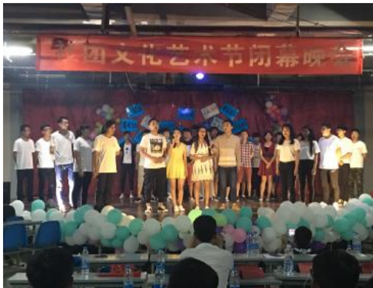
< = > ? @ A > B ) C D E F E < G O 8 * / 16 3 4 9 : ; 7

. . / O 1 2 16 3 4 5 # { ~ 6 7 5 2 6 ! " # $ % & ' ( n 7 ; ) * + , - . / - O 1 2 3 u 4 5 # 6 O 7 ' 8 9 3 : 5 ; = > ; ? @ 魅力 # 魔 @ < 7 ' = > ? @ A B C 7 1 5 D 7 ; 魔 @ 瓶子与罐子 给人 E F G # H I J ; K L M - N 前 ~ 亮 # = - 7 ; 音乐 3 4 O P Q R S T U V V W X 猫人 构思 巧奇 # W A = Y S Z [ \ ] ^ _ ^ W ` 扣人心弦 # 7 7 ' ; a S 7 ' 8 9 3 4 O b c S 7 舞蹈表 y 得 阵阵掌 ' 8 9 3 d e b f S 7 ' 8 9 声 # 太 7 ; 太 表 武 3 _ 4 O ` g S h i j _ d e @ 协 3 ; 棍舞狂沙 r s k l m n 3 2 ; & 春 力 . 超 ; 运 o p 7 ' = > ? @ A q 技巧 # 爆 z 气氛 n " 3 # < r s t 6 S = > u : S Z v w $ 7 ' 8 9 3 4 O b c 宣布获 x S y C z C B [ 4 | # ) ~ • 奖集体 # 武 @ 协 3 荣获 < 五星 Z v = > S r s 7 ' 7 ' B # 星辰创业协 3 S 6 ° C 轮 # C . 7 ' 2 滑 7 S 太 协 3 S 博雅 = - 7 ; # { 7 ' ~ 被 { < 四星 7 ' B # 7 S r s 7 ' = > S 7 7 S 象棋 7 S 摄影 7 S 魔 @ ' ; n C ~ 7 S 爱心 7 被 { < 三星 7 # - N 7 ' C 7 ' r s ' B # $ 出 O K L { 获 r s 7 ' ; # 集体颁奖 n n 7 ' 8 9 3 9 7 ' = > ? @ A 是 Z v = 7 ' r w j ~ > ; 浓缩 # 是 6 O F 5 7 ; + 7 ' ; # 是融 9 D 7 ' n 育 果 ; 又 ~ 次重要 r s # 旨 = ? " 3 C 7 ; C 携手 - 子 % 享 7 ' = > # # % 创 7 ' 发 r 模式 # % y # 7 ' ; A 美好 7 ' 未 n