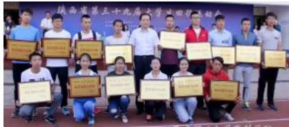
荣获陕西省第十九届大学生田径运动会“体育道德风尚奖” 100米、200米、400米、800米、1500米、5000米、4x100米接力、跳远、67 d A 顽5、纪律FP5、+? 突破口, qr. 人为, 倡 A 锻炼, V 断. A tu 道德 [ 因素B$ J KY, 积 7 CD 素B, 推3 园 L 建设。 Cj k; st G

为3 4推7陕西 阳光 67,切 O A BCD ] ^, 陕西 第三g九 届O A 67 5 25 至27 西 举。 积极 G, D出11 6 7 +?, d +? p 顽5拼搏, 恪 道德 O A 67 p 荣 r " 道德AI"。 y 悉, 67= Y l n 82 所 & 1890 人, +? 括 ? $ >?, 设 = 男c、女c 100 米、 200 米、5000 米、> 走、 跳、跳远、枪 S 22 。 陕西 第三g九届 O A O 6 p 改革$ p, 牢固